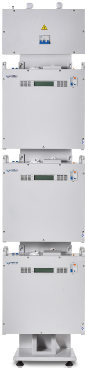
Рис.2. Размещение стабилизаторов на стойке.