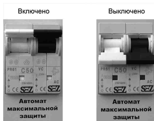
Рис.3. Положение автоматического выключателя

На верхней панели стабилизатора расположены (рис.4):