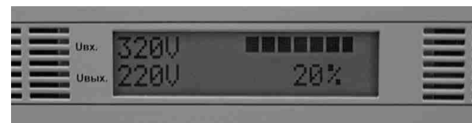
Рис. 2. Жидкокристаллический индикатор

На лицевой панели корпуса расположены жидкокристаллический индикатор (Рис.2), который в режиме «стабилизация» отображает входное и выходное напряжение, состояние электронных ключей и ток нагрузки в процентах, а также автоматический выключатель с независимым расцепителем (Рис.3).