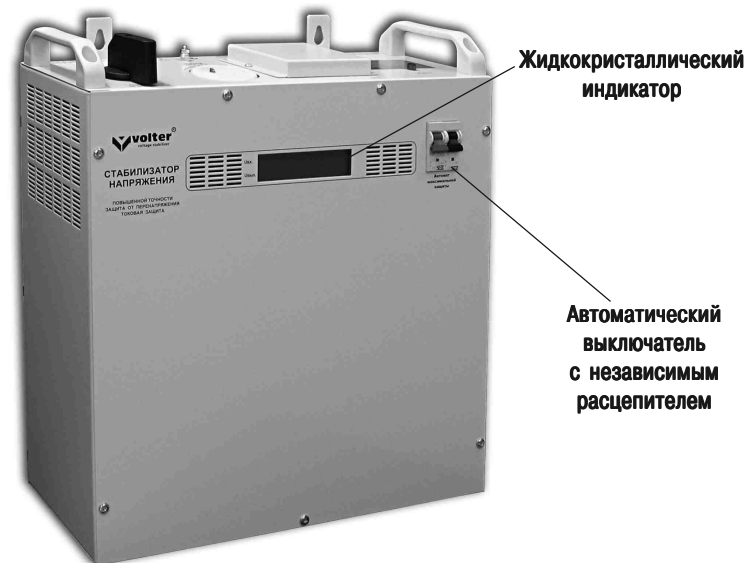
Рис. 1. Стабилизатор напряжения

Стабилизатор (рис.1) выполнен в металлическом корпусе прямоугольной формы, который позволяет эксплуатировать его как в настенном, так и в напольном варианте. Все функциональные узлы стабилизатора расположены на шасси, которое закрыто лицевой частью корпуса и днищем. Для удобства переноски стабилизатора имеются ручки.